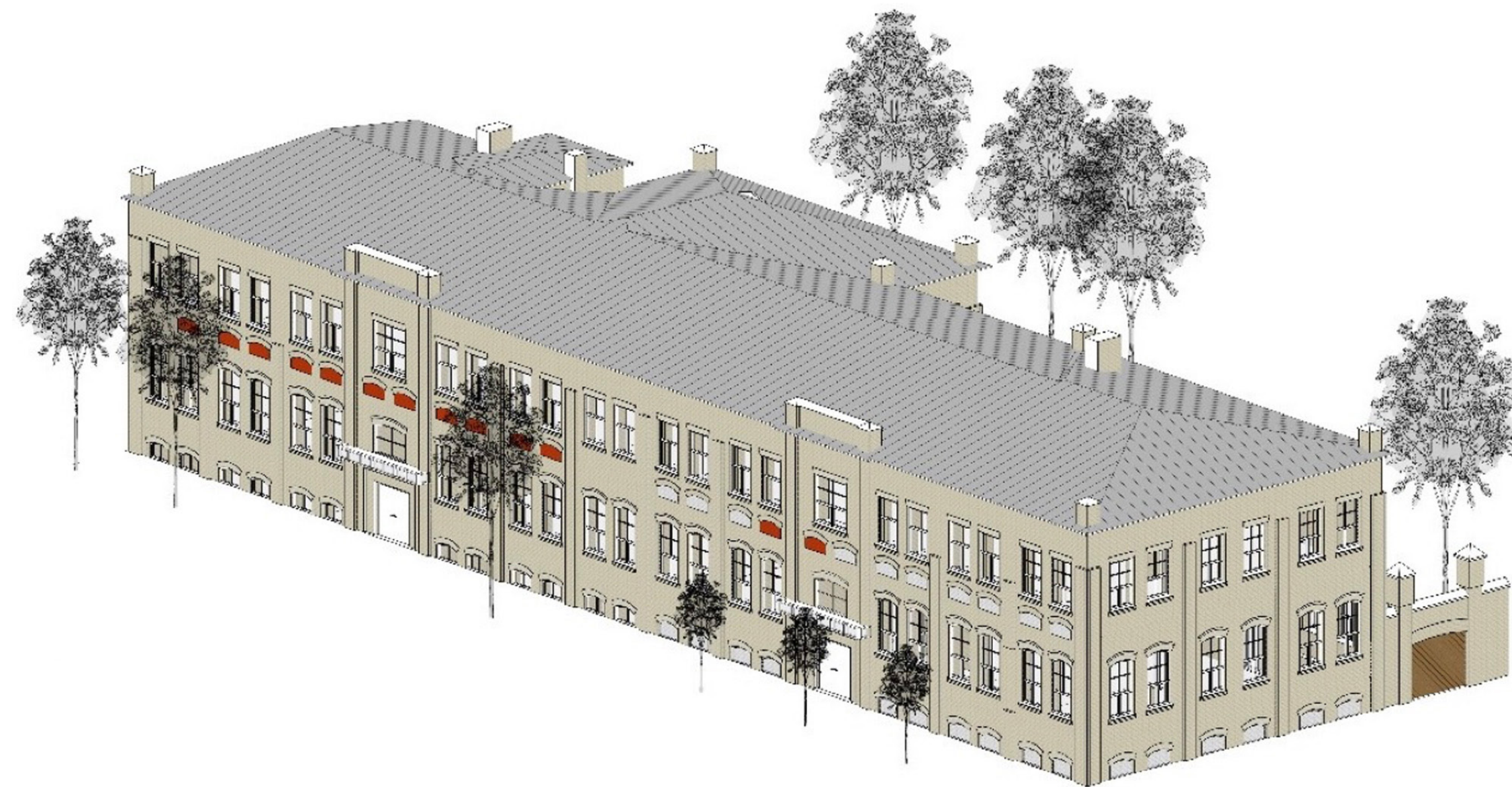
Arhitektu biroja “Vilnis Mičulis” vizualizācija.

2024. gada 27. martā Kim? pārvaldībā tika nodota ēka Hanzas ielā 22, ar mērķi ēku atjaunot un nodrošināt tajā laikmetīgās mākslas un izglītības norises.